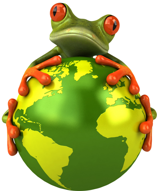
Illustration : http://www.rge-info.fr/

Préserver l'environnement, ça coûte cher ? Ça prend trop de temps ? C'est compliqué ? Pas forcément ! Grâce à ce petit livret, découvrez comment tendre vers un mode de vie responsable... en trois étapes.