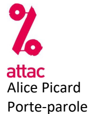
Alice Picard Porte-parole